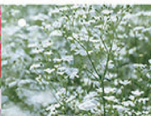
かすみ草 花ごよみ 純愛・誇らかな心 1 2 3 4 5 6 7 8 9 10 11 12