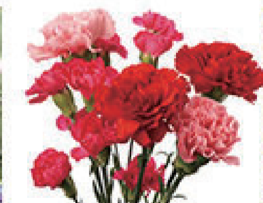
カーネーション 花ごよみ 純粋な愛情・感動 1 2 3 4 5 6 7 8 9 10 11 12