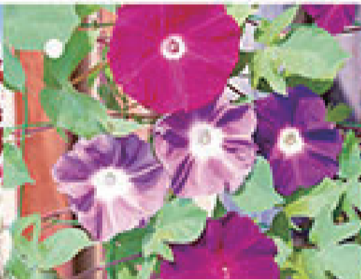
朝顔 花ごよみ 愛情・約束 1 2 3 4 5 6 7 8 9 10 11 12