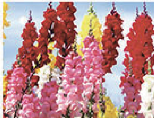
金魚草 花ごよみ 鮮やか・おしゃべり 1 2 3 4 5 6 7 8 9 10 11 12