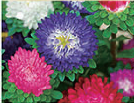
アスター 秋から冬にかけて咲く。葉の切り端に鋸歯がある。アスターの属名「アステラス」には「美しい花」という意味がある。 花ごよみ 美しい花 1 2 3 4 5 6 7 8 9 10 11 12