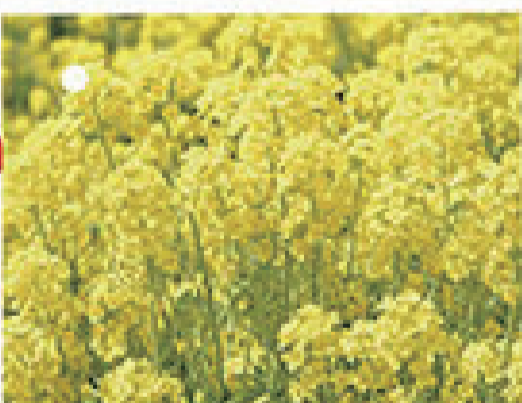
菜の花 花ごよみ 純粋・輝やか 1 2 3 4 5 6 7 8 9 10 11 12