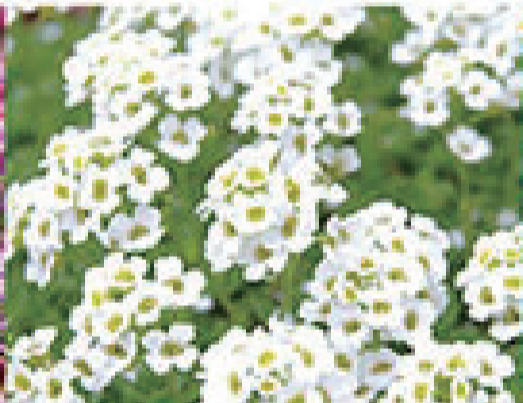
アリッサム 花ごよみ 可愛・純愛 1 2 3 4 5 6 7 8 9 10 11 12