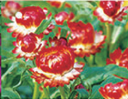
ヘリクリサム 地中海沿岸の原産。花は筒状で、筒の先端が裂けて花びらのように見える。花ごよみ 黄金の輝き・永遠 1 2 3 4 5 6 7 8 9 10 11 12