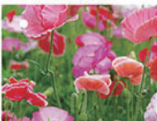
ポピー 花ごよみ 純愛・思いやり 1 2 3 4 5 6 7 8 9 10 11 12