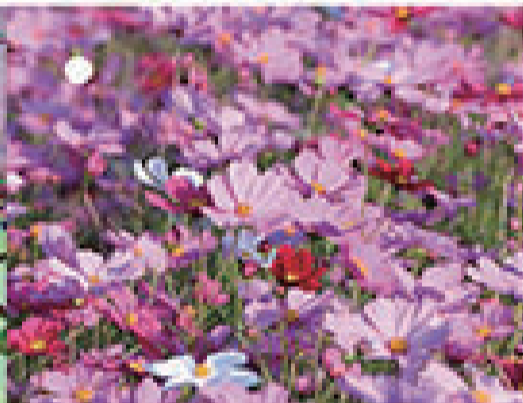
コスモス 花ごよみ まごころ 1 2 3 4 5 6 7 8 9 10 11 12