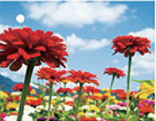
百日草 花ごよみ 鮮・早熟 1 2 3 4 5 6 7 8 9 10 11 12