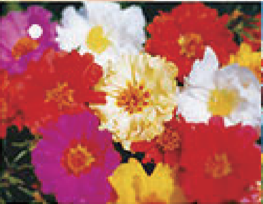
松葉牡丹 秋から冬にかけて咲く。花ごよみ 可愛・無邪気 1 2 3 4 5 6 7 8 9 10 11 12